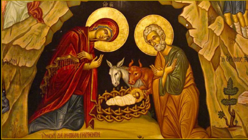
Representación del nacimiento de Jesús en la Basílica de la Natividad de Belén.

« Esta bella noche, henchida de tinieblas y fuegos que la atraviesan como los peces hienden el mar, te está esperando. Te espera al borde del camino, tímida y tiernamente, porque Cristo ha venido para regalártela. Lánzate hacia el cielo y serás libre -¡Oh criatura superflua entre todas las criaturas superfluas!-, libre y palpitante, asombrada porque existes en pleno corazón de Dios, en el reino de Dios, que está así en el cielo como en la tierra ».